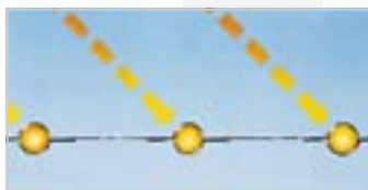
Painel tradicional alumínio / cobre

A utilização dos painéis selectivo na Série "K" da Solahart melhorou o desempenho do "circuito fechado" tornando-o um dos sistemas mais eficazes de aproveitamento de energia solar para o aquecimento de água.